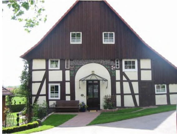
Abb. 1: Hof Wehren Nr. 8 Vogelsmeyer Leibzucht